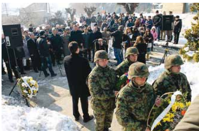
Полагањем венаца на споменик Чика Мити испред зграде Начелства, одата пошту погинулима у борбама за ослобођење Врања од Турака, 31. јануара 1878. године.