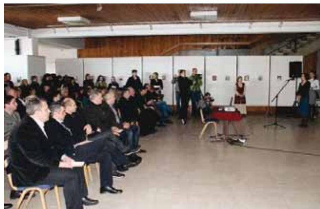
У Галерији Народног музеја, отворена изложба фотографија „Врање – људи и догађаји“, у организацији Историјског архива „31. јануар“.