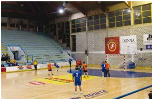
Хуманитарни турнир у малом фудбалу. Победник турнира екипа 4. бригаде Војске Србије. Екипа Града Врања освојила 3. место.